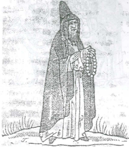
رسم رقم (٨) أحد رجال الدين اليونانيين ممسكاً بمسبحة

كذلك للمسيحيين واليهود شارع خاص في المدينة، أى أن هناك شارع للنصارى وآخر لليهود يغلق عليهم في المساء (١) .